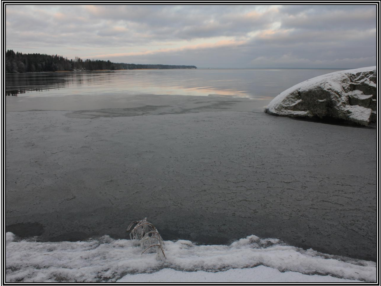
Säskylän Kolvaa, 1.1.2012